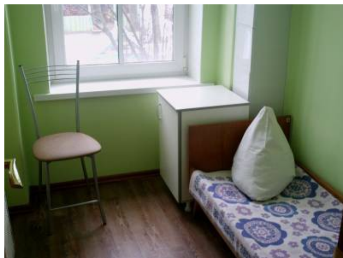
В ДОУ имеется процедурный кабинет и изолятор